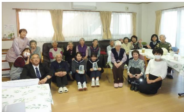
(グループホーム ふきのとう)