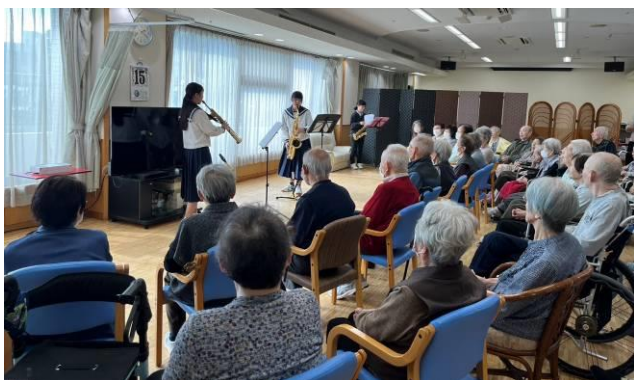
(ケアハウス グレイスフル下諏訪)