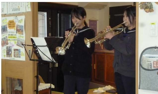
(グループホーム ふきのとう)