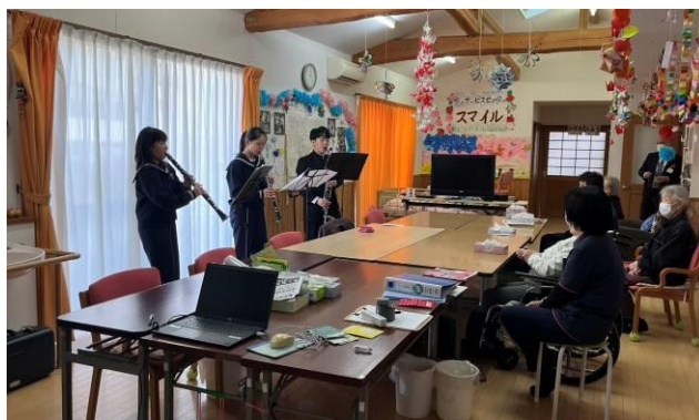
(デイサービスセンター スマイル)